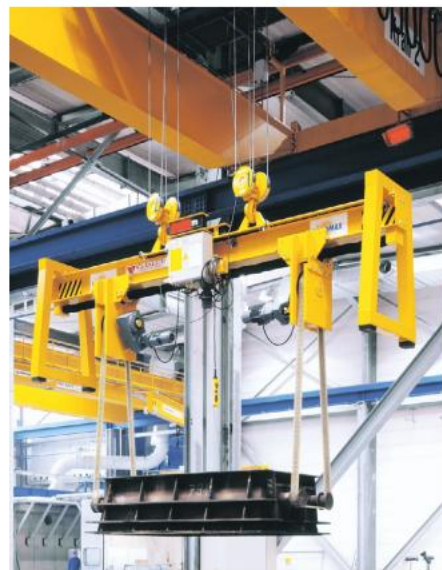
T Pojemność: 12 ton Odległość pasa: 1700 – 5000 mm Modyfikacja: elektryczny