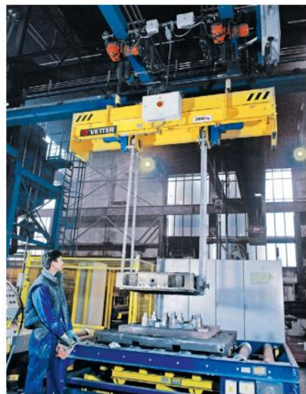
T Pojemność: 2 tony Odległość pasa: 900 – 2000 mm Modyfikacja: elektryczny