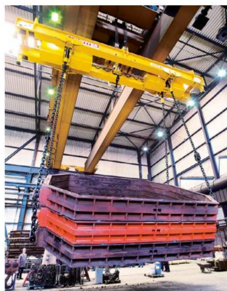
T Pojemność: 125 ton Odległość pasa: 3050 – 8800 mm Modyfikacja: elektryczny