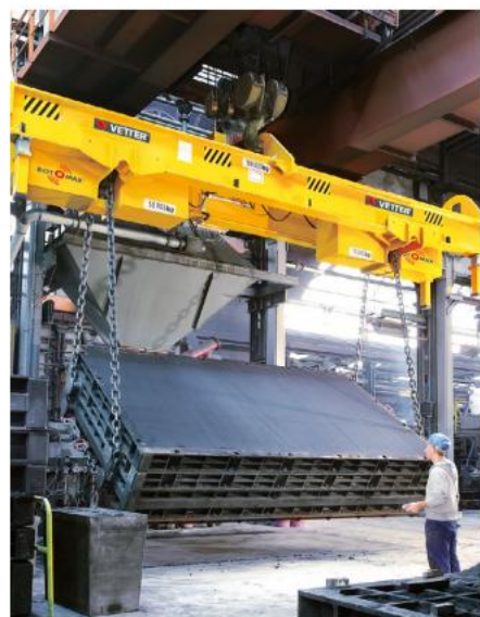
T Pojemność: 100 ton Odległość pasa: 2900 – 7000 mm Modyfikacja: elektryczny