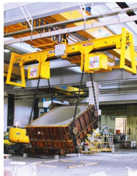
T Pojemność: 30 ton Odległość pasa: 1200 – 5500 mm Modyfikacja: elektryczny